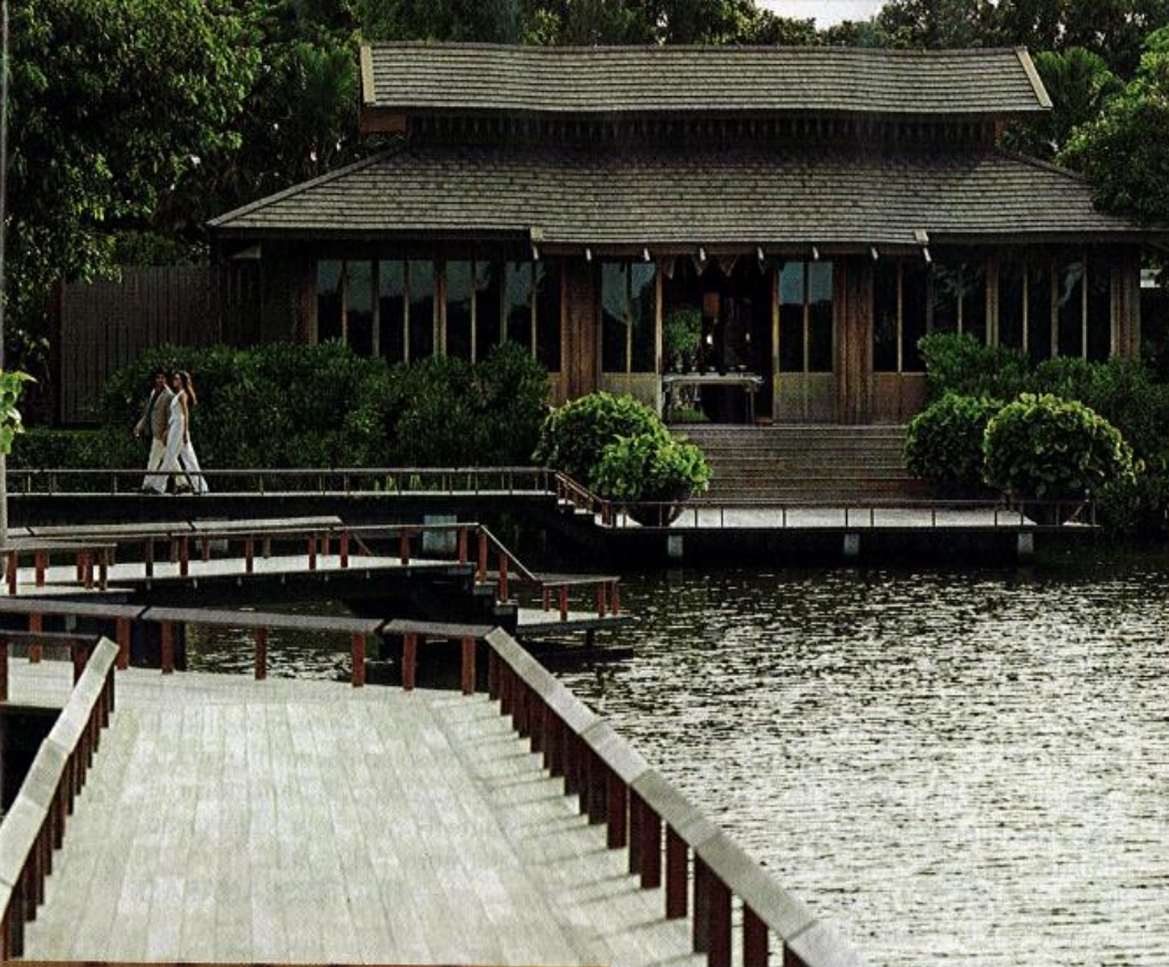
Nella pagina accanto e a sinistra, alcuni scorci del RAKxa Integrative Wellness , medical retreat situato nel polmone verde del fiume vicino a Bangkok. In basso, uno dei momenti clou del Thai Ya-Pao Detoxification Therapy , con scodella fumante sul ventre. Infusi alle erbe bio. Il destressante Thai Pure Nutrient Hair And Scalp Treatment .